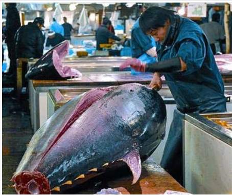
Un operario trocea un atún rojo en la lonja de pescado de Tsukiji (Tokio), la mayor del mundo, el mes pasado.