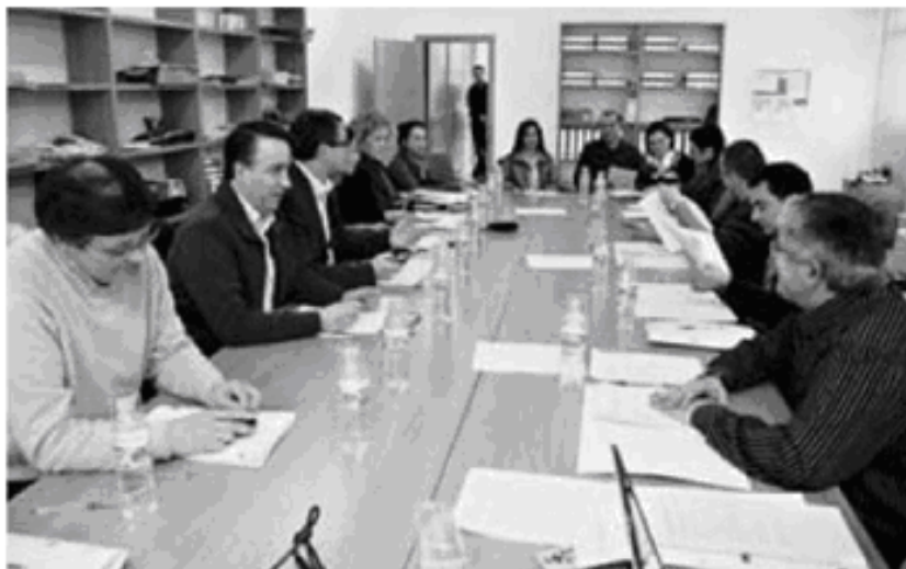
Los proyectos habían sido valorados por el Pacto Territorial de Empleo antes de ser remitidos al ministerio (x. s.).

El plan del Ministerio incluye también una línea de ayudas para infraestructuras a la que optaban siete proyectos de la comarca. En este caso, han sido aprobados los planteados por los concellos de Zas, A Laracha y Muros en el ámbito del suelo y los servicios empresariales.