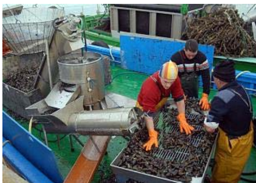
Bateiros gallegos, durante la recogida del mejillón.