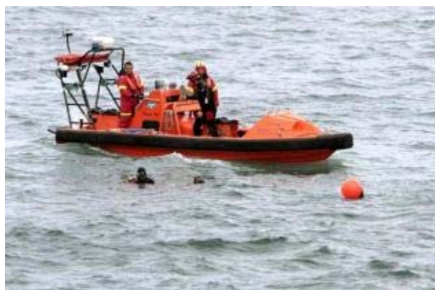
Varios buzos junto a una embarcación de Salvamento durante el rastreo tras el naufragio de un pesquero.

MANUEL BARRAL Los Centros de Coordinación de Salvamento (CCS) de Galicia registraron un incremento de la actividad durante el año pasado como consecuencia, principalmente, del aumento de las emergencias de buques de pesca. Las alertas de pesqueros atendidas por las bases gallegas de Sasemar aumentaron un 20% respecto a 2008, al pasar de las 113 intervenciones de ese año a las 137 del pasado ejercicio. De estas, la mayor parte fueron gestionadas por el CCS de Fisterra (112), otras 13 correspondieron al centro de A Coruña y sólo 12 al de Vigo, según los datos facilitados por Salvamento Marítimo.