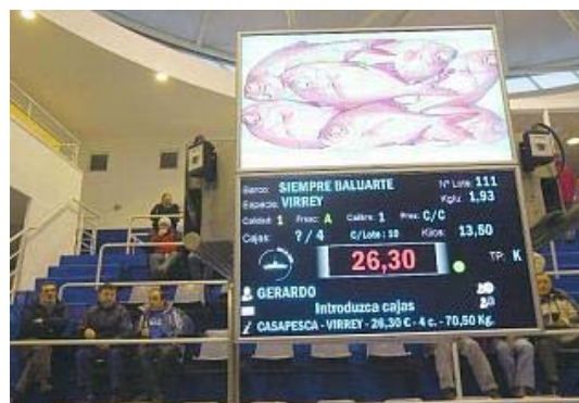
Subasta de pescado en la nueva rula de Avilés. miki lópez

Los comercializadores de pescados ya no van a ciegas a la rula de Avilés. Y es que ya pueden conocer de antemano qué especies se van a rular cada día, qué cantidad de cajas de pescado hay y de dónde procede. Los responsables de la lonja avilesina ya han puesto en marcha el catálogo de venta, aún en pruebas, por el que, a través de pantallas, se informa a los compradores sobre lo que se va a subastar en cada jornada.