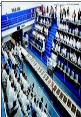
Venta de pescado en la nueva rula de Avilés.

RA Nvilés se consolidó durante el año pasado como principal puerto pesquero de Asturias. No sólo sigue siendo el que más facturación aporta al cómputo total de la región sino que mientras que su máximo competidor, el de Gijón, sufre un ligero descenso en cuanto a capturas las de la rula local han crecido, incluso por encima de la media del Principado.