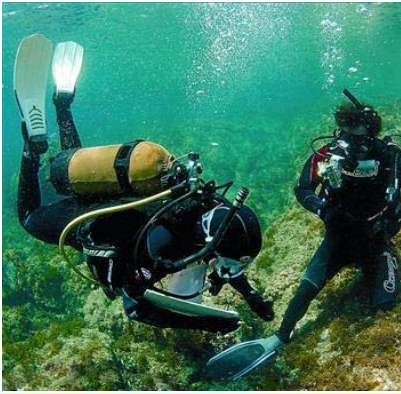
Dos submarinistas del proyecto Silmar toman muestras del fondo marino.